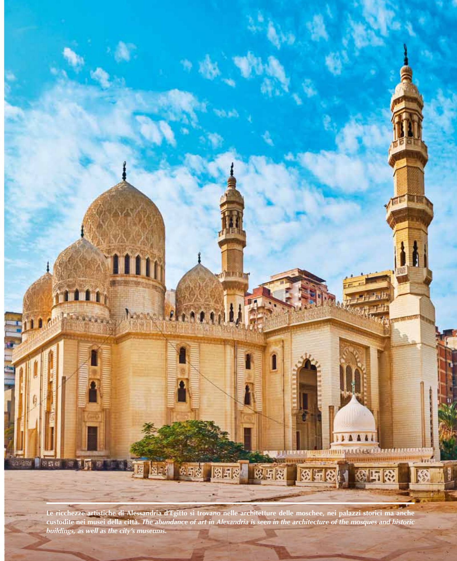
Le ricchezze artistiche di Alessandria d’Egitto si trovano nelle architetture delle moschee, nei palazzi storici ma anche custodite nei musei della città. The abundance of art in Alexandria is seen in the architecture of the mosques and historic buildings, as well as the city’s museums.

Il litorale offre diversi tratti di spiaggia da Maamoura a est fino alla spiaggia Agamy a ovest di Alessandria. La costa è lunga ben 70 chilometri, dall’estremità nord occidentale del delta del Nilo al Lago Mariout a est punteggiata da affascinanti baie e porti, come Abu-Qir e il Porto Orientale di Alessandria a forma di falce di luna, sovrastato dalla maestosa Fortezza Qaitbay .