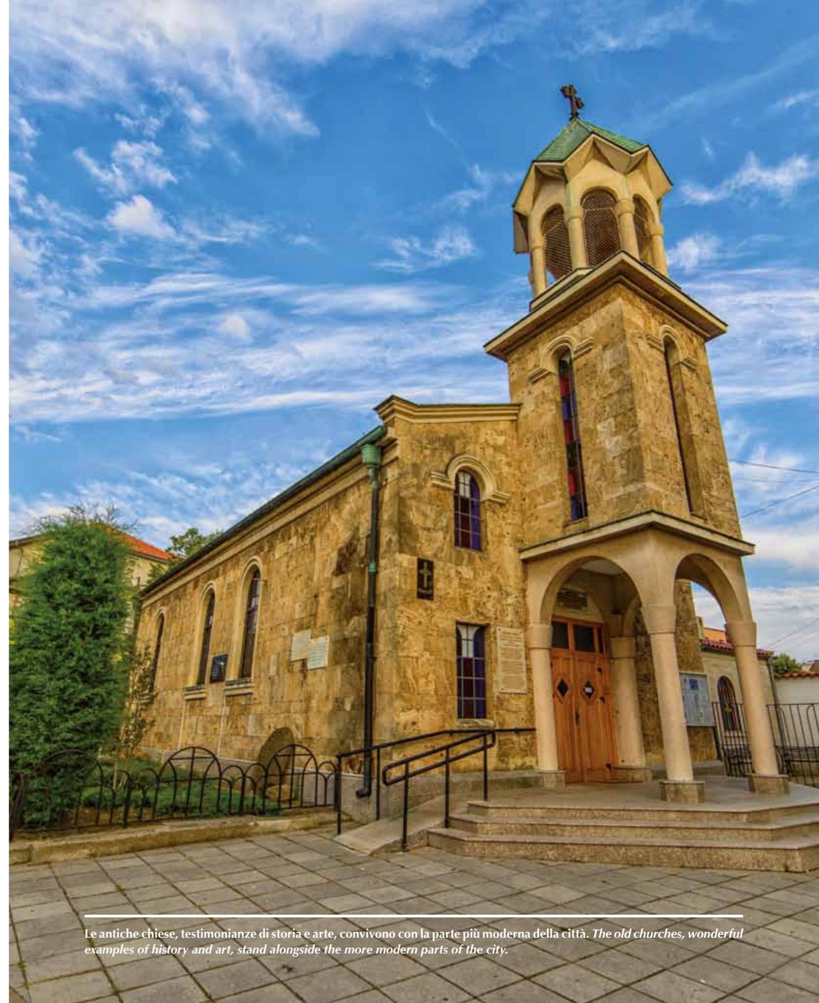
Le antiche chiese, testimonianze di storia e arte, convivono con la parte più moderna della città. The old churches, wonderful examples of history and art, stand alongside the more modern parts of the city.

Burgas mostra un carattere multietnico, che si manifesta anche nelle sue specialità culinarie , di derivazione turca, balcanica, greca: da provare il Tarator , una zuppa fredda di cetrioli e yogurt - questo considerato tra i più squisiti e benefici d'Europa -, gli involtini di cavolo, le rinomate zuppe , di fagioli, di pomodoro con formaggio, con polpette di carne, il tutto annaffiato dal particolare vino resinato , che ha nome Mastika .